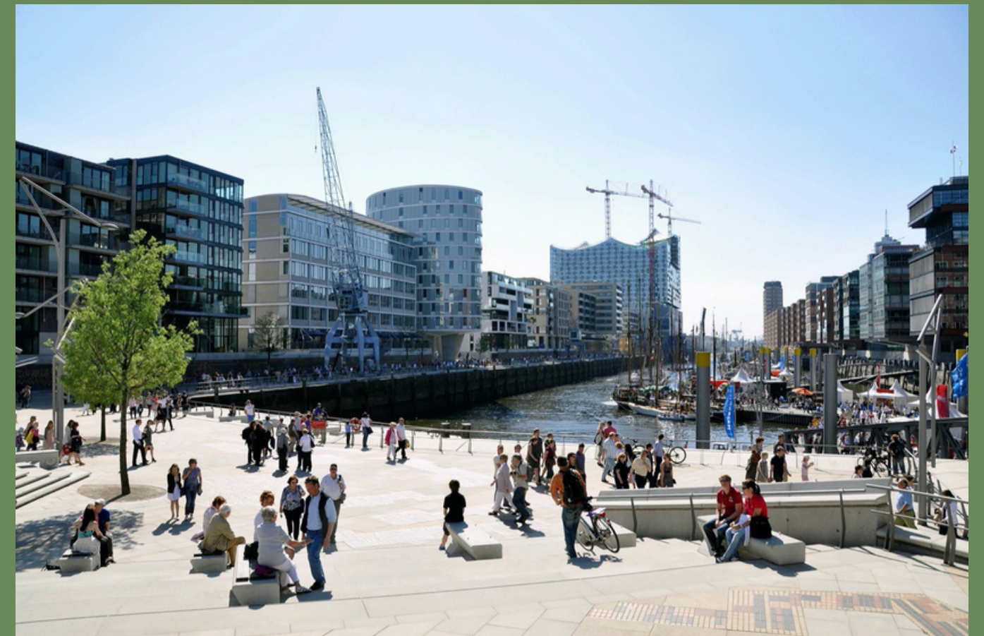
Requalification de friches portuaires au quartier HafenCity, à Hambourg