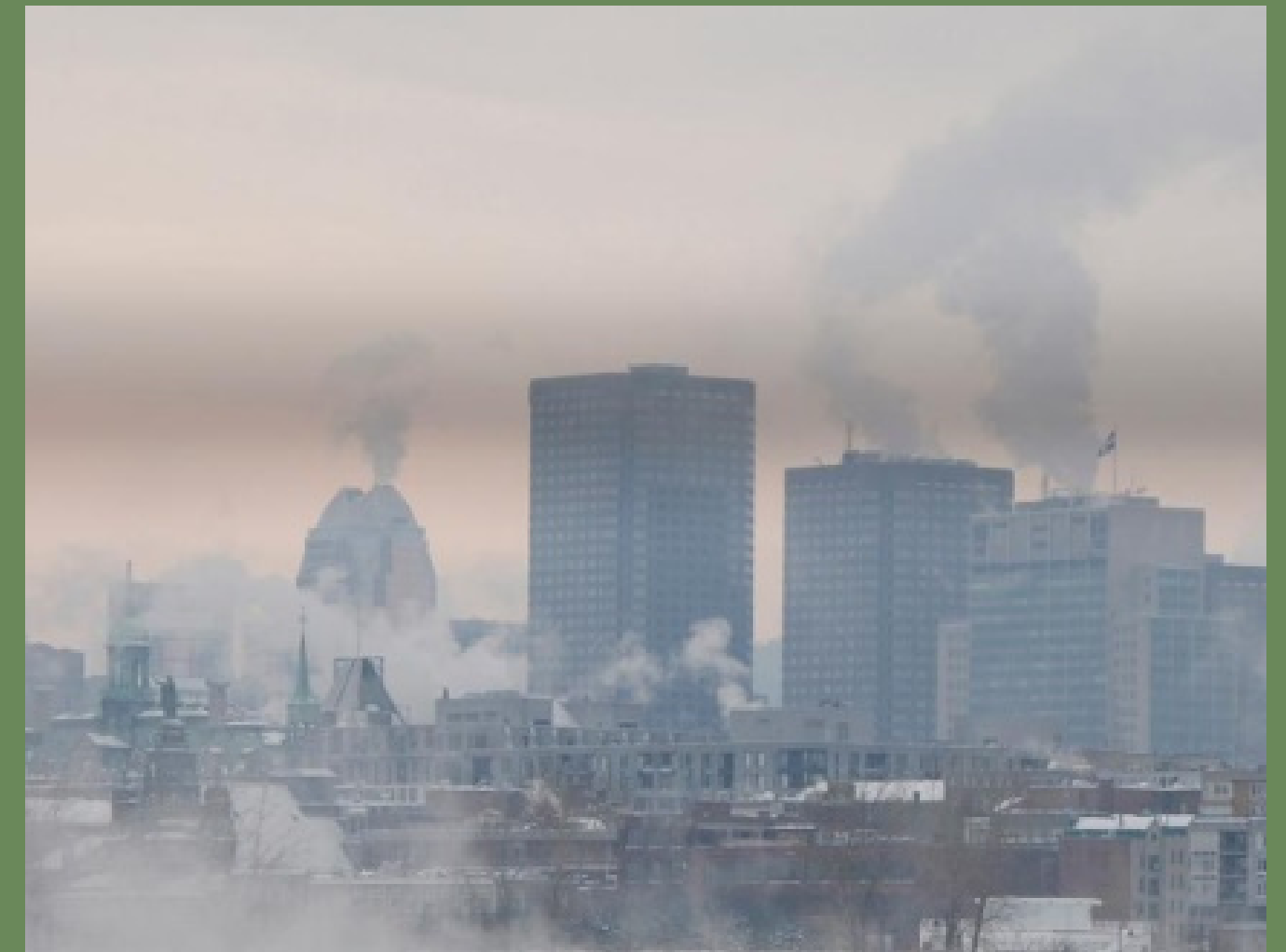
Épisode de smog à Montréal en 2020

Solution : maximiser les efforts pour préserver la qualité de l'air!